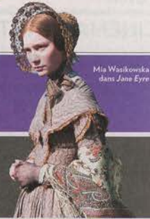
Mia Wasikowska dans Jane Eyre

MIA WASIKOWSKA / JANE EYRE UNE HEROÏNE EN HÉRITAGE PAGE 8